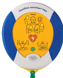
HeartSine samaritan PAD 350P Trainer (TRN-350-XX*)