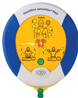
HeartSine samaritan PAD 500P Trainer with CPR Advisor simulation (TRN-500-XX*)

Die samaritan PAD-Trainer sind nicht in der Lage, eine Arrhythmie zu diagnostizieren oder zu behandeln. Sie sind ausschließlich zur Simulation der Anwendung eines AED für Schulungszwecke vorgesehen.