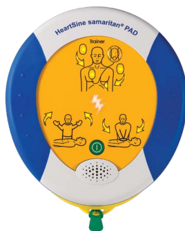
HeartSine samaritan PAD 360P Trainer (TRN-360-XX*)