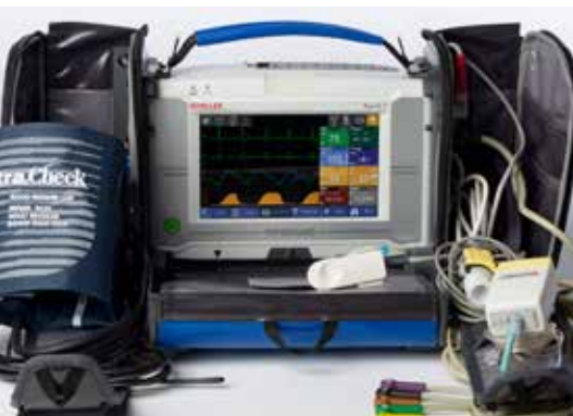
PHYSIOGARD TOUCH 7 MONITOR