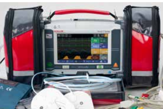
DEFIGARD TOUCH 7 MONITOR / DEFIBRILLATOR

Der DEFIGARD Touch 7 und PHYSIOGARD Touch 7 (DGT7/PGT7) sind unverzichtbare Hilfsmittel für Ersthelfer. Als Version mit Defibrillator und Monitor, oder nur mit Monitor, bietet das besonders kompakte Gerät modernste Defibrillationstechnik und umfassende Überwachungsfunktionen in Einem. Er ist der erste Notfall-Monitor/Defibrillator, welcher über einen Touchscreen verfügt und sich durch modernste Datenübertragung und intuitive Bedienung auszeichnet.