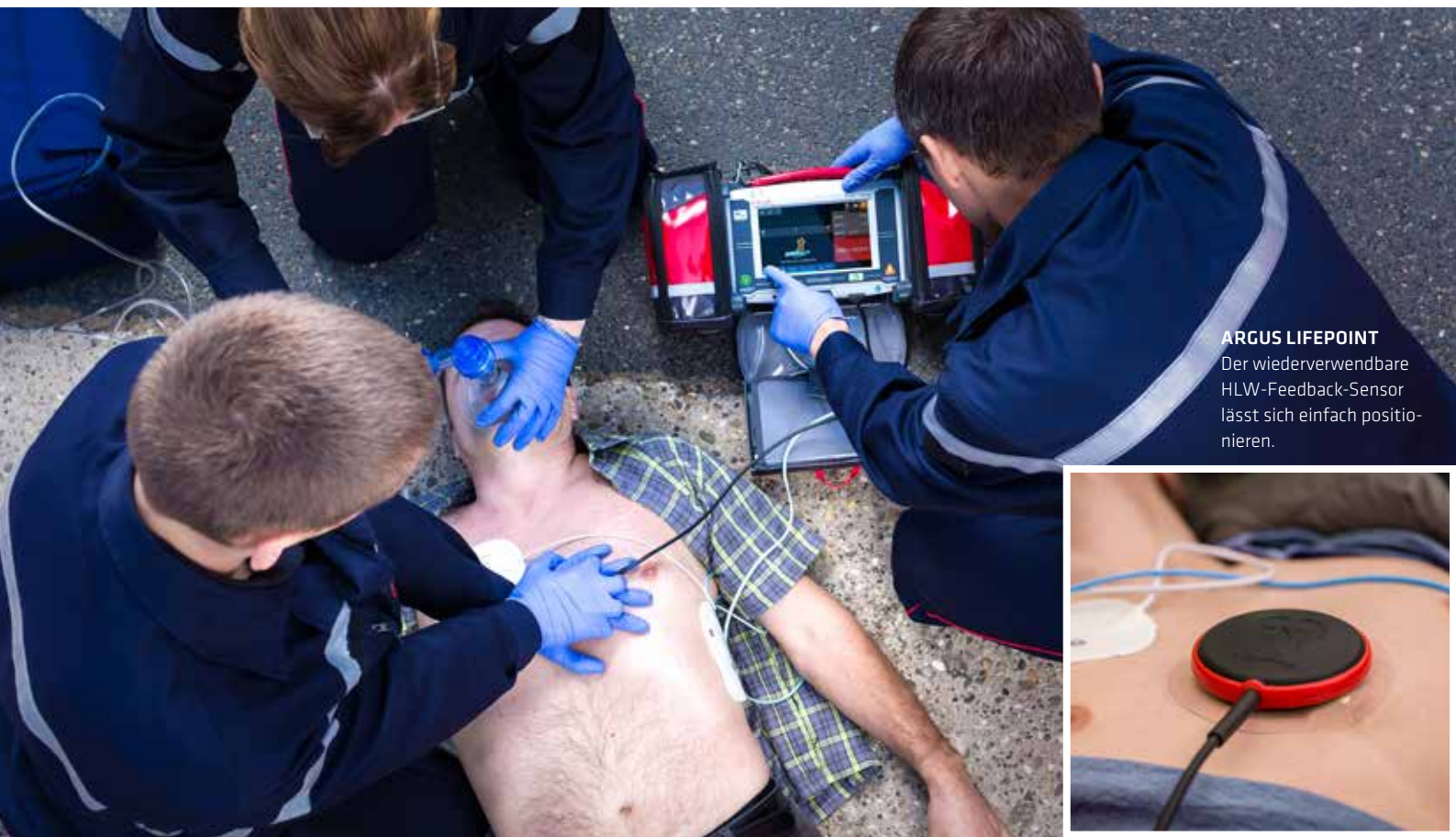
ARGUS LIFEPOINT Der wiederverwendbare HLW-Feedback-Sensor lässt sich einfach positionieren.